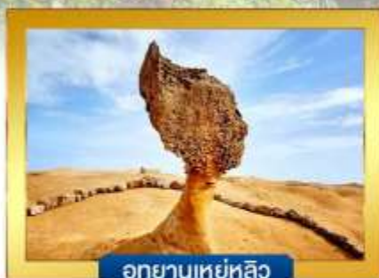
อุทยานเหย่หลิว