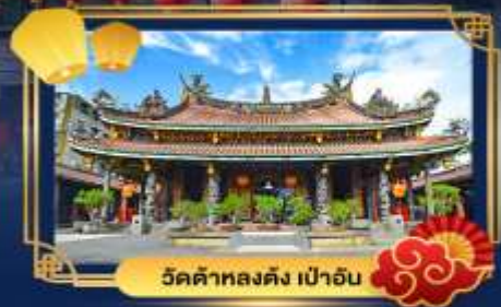
วัดต้าหลงต้ง เป่าอัน