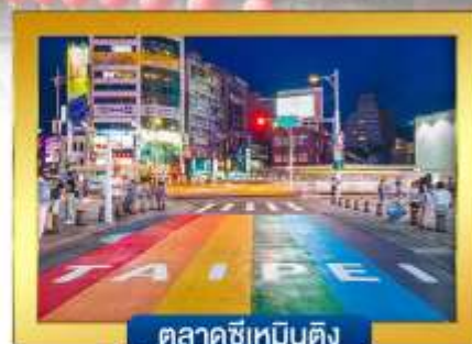
ตลาดซีเหมินติง