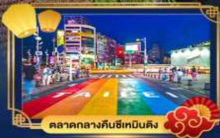
ตลาดกลางคืนซีเหมินติง