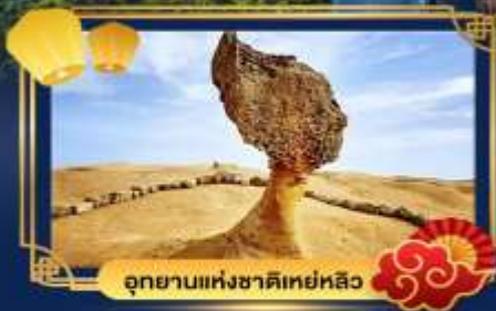
อุทยานแห่งชาติเห่หลิว