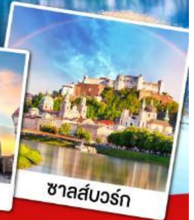
ชาลส์บวร์ก

เที่ยวหมู่บ้านอัลสติกที่สวยงามที่สุดในโลก เข้าชมความงดงามภายในของปราสาทน้อยชวานส์ไตน์