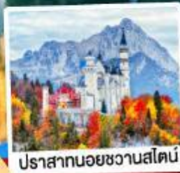
ปราสาทน้อยชวานส์ไตน์