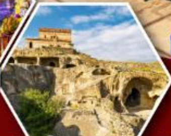
เมืองถ้ำอพลิสตซิคเคท์