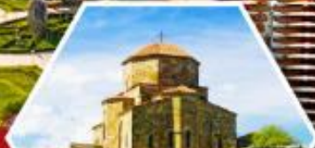
วิหารกอรี