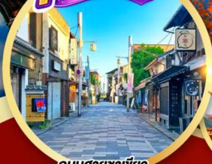
ถนนสายชาเขียว