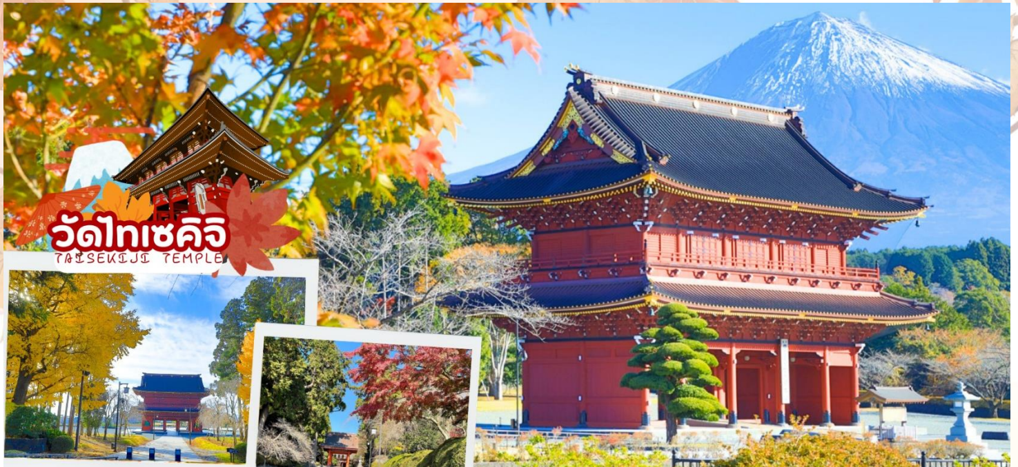
วัดไทเซคิจิ TAISEKIJJI TEMPLE

กลางวัน รับประทานอาหารกลางวัน ณ ร้านอาหาร (มื้อที่ 3)