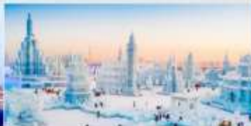
เทศกาลคอมไฟน้ำแข็ง