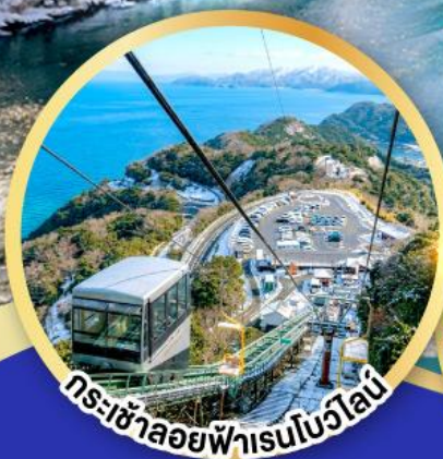
กระเช้าลอยฟ้าสโนว์ไลน์