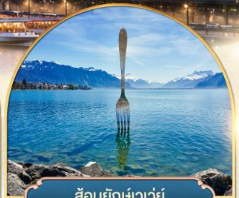
ส้อมยักเขาวัว