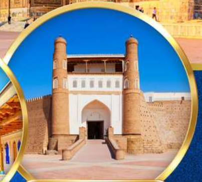
THE ARK FORTRESS