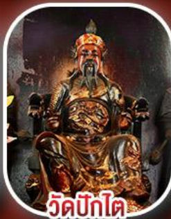
วัดปิกไต้