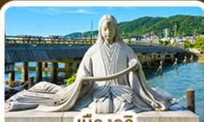
เมืองอิจิ สวรรค์คนรักชาเขียว