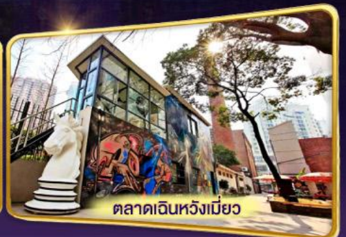
ตลาดเดินหวังเมี่ยว