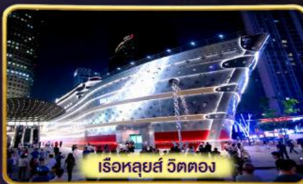
เรือหลุยส์ วัดตอง