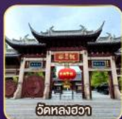
วัดหลงฮวา