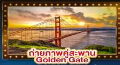
ถ่ายภาพคู่สะพาน Golden Gate