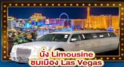
นั่ง Limousine ชมเมือง Las Vegas