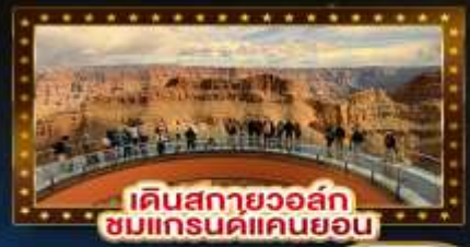
เดินสกายวอล์ก ชมแกรนด์แคนยอน