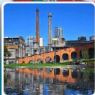
Eastern Suburb Memory Chengdu