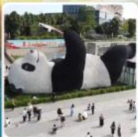
รูปปั้นแพนด้าเซลฟี่