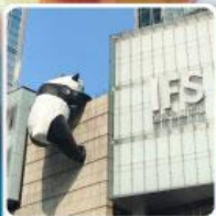
แพนด้ายักษ์ปีนตึกIFS