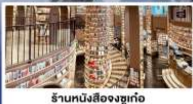
ร้านหนังสือจงซูเก้อ