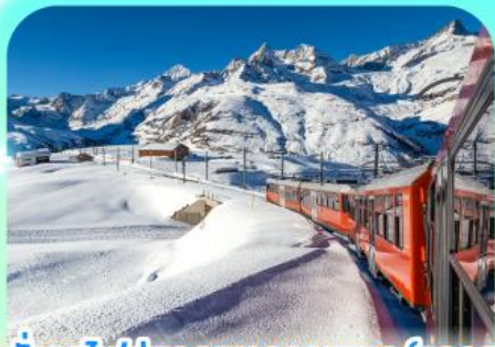
นั่งรถไฟสู่ยอดเขารอนเนอร์เกรต

สวยสะท้านฟ้าที่สวิสฯ สะกิดรักที่โดม พีชิตาแมททอร์ฮอร์นและจุงเฟรา