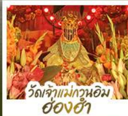
วัดเจ้าแม่กวนอิมอ่องฮ่า