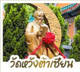
วัดเว้งต้าเซ็งแะ