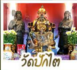
วัดป๊กโต