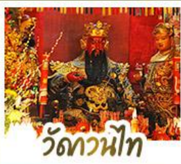
วัดกวนน้้ไท