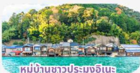
หมู่บ้านชาวประมงอินะ