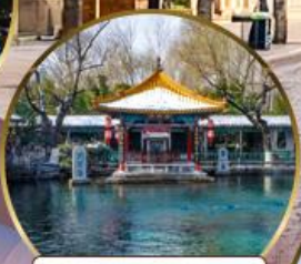
น้ำพุเปาหู