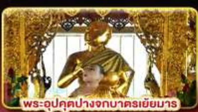
พระอุปกุศปางจกบาตรเยี่ยมมาร