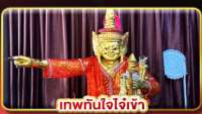
เทพทันใจใจเจ้า