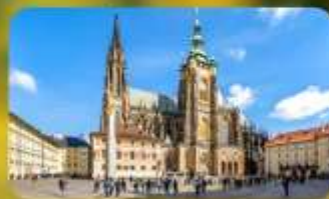
เข้าชม 2 ปราสาท ปราก และเซินบรุนน์