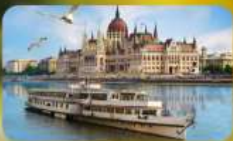
ส่องเรือแม่น้ำดานูบ พร้อมจิบแชมเปญ