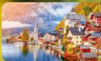
การันตีพัก Hallstatt / St. Wolfgang หรือริมทะเลสาบ 1 คืน