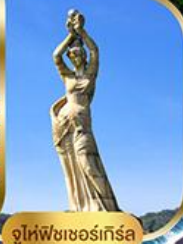
จูไห่ฟิชเชอร์เก็สรา