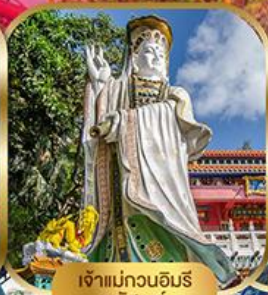
เจ้าแม่กวนอิม พลึงสมัย