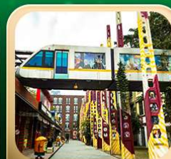
“ดงเจียวจื่อ”