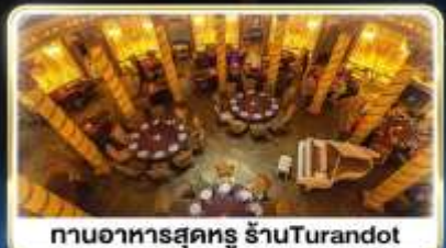
ทานอาหารสุดหรู ร้านTurandot