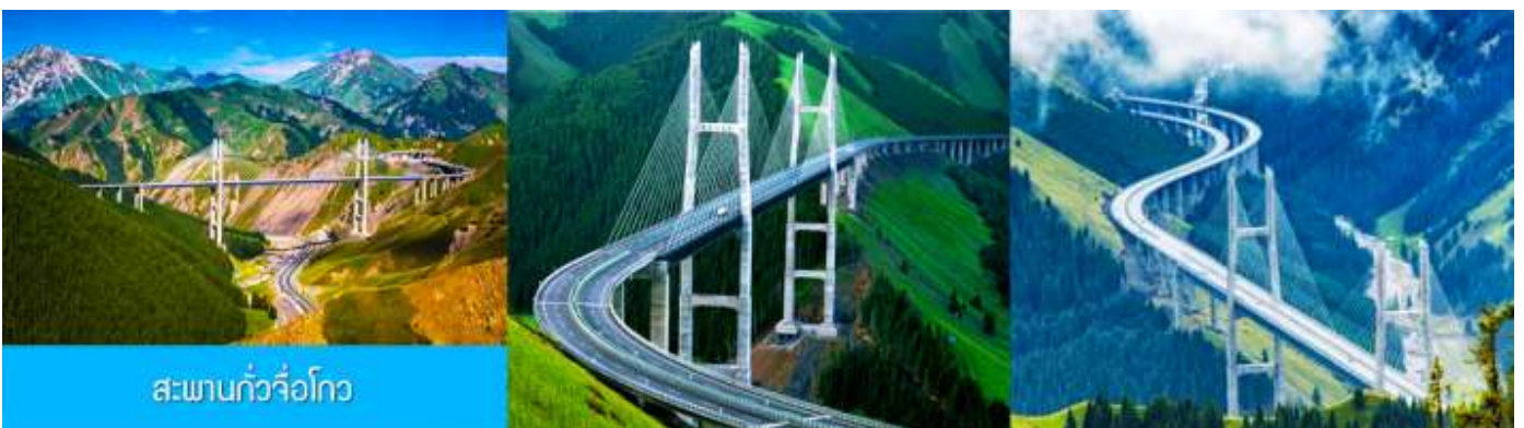
สะพานกั๋วจื่อโกว

หลังอาหารนำท่านเดินทางโดยรถบัสสู่ ตำบลนำลาตี 那拉提 (ระยะทาง 300 กม. ใช้เวลาเดินทางราว 4 ชั่วโมง)