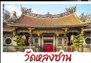
วัดเจหลงซาน