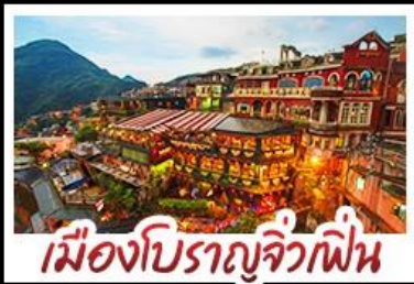
เมืองโบราณจิวเฟิน

เที่ยวธรรมชาติระดับโลก เอเชีย ทะเลสาบสุริยันจันทรา - เมืองดังครบ ไทย จิวเฟิน - ซีเหมินติง