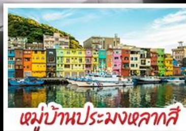
หมู่บ้านประมงเหลากสี