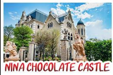
NINA CHOCOLATE CASTLE

ทะเลสาบสุริยจันทรา - ไทเป 101 จิวเฟิน - NINA CHOCOLATE CASTLE MONSTER VILLAGE - ซีเหมินติง เมนูพิเศษ ปลาประจานาธิบดี ชื้อวหลงเปา / ซาบูใต้หวัน