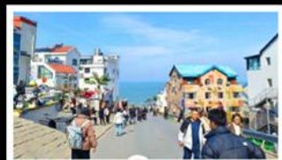
ถนนคอปเพิลิงหมายเลข 8

สัมผัสความยิ่งใหญ่ของ 4 เมืองสำคัญ ชิงเต่า - เยียนโก - เฟิงไห่ - เว่ยไห่ ปาต้ากวน - โบสถ์คาทอลิก - ตึกเก่าริมหา