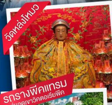
วัดหล่งโคม ธรรมาพิคเทรม สูยอศเวาริคศอเรียพิค