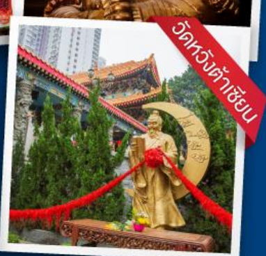
วัดหวังต้าเซี่ย