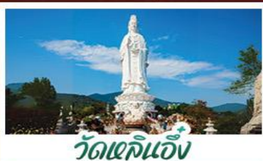
วัดเข็อิน