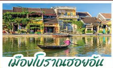
เมืองโบราณเฮอฮอัน

! พักบนเขานาฮิลล์ 1 คืน ! สัมผัสอากาศเย็นตลอดปี สตรีตฟรังเศสสุดคลาสสิก - นั่งกระเช้ายาวที่สุด สู่มานาฮิลล์ สนุกสุดมันส์ไปกับสวนสนุก The Fantasy Park มันิสการเจ้าแม่กวนอิมองค์ใหญ่ที่สุดของเมืองดานัง - เข็อินเมืองมรดกโลกฮอยอัน - สนุกสนานไปกับกิจกรรม!!นั่งเรือกระดิง หมู่บ้านกัมถาน เข็อินร้านกาแฟ SON TRA MARINA CAFE - ไม่หลงร้านช้อปปิ้ง - อิ่มอร่อยกับบุฟเฟ่ต์นานาชาติ , หม้อไฟซีฟู้ด