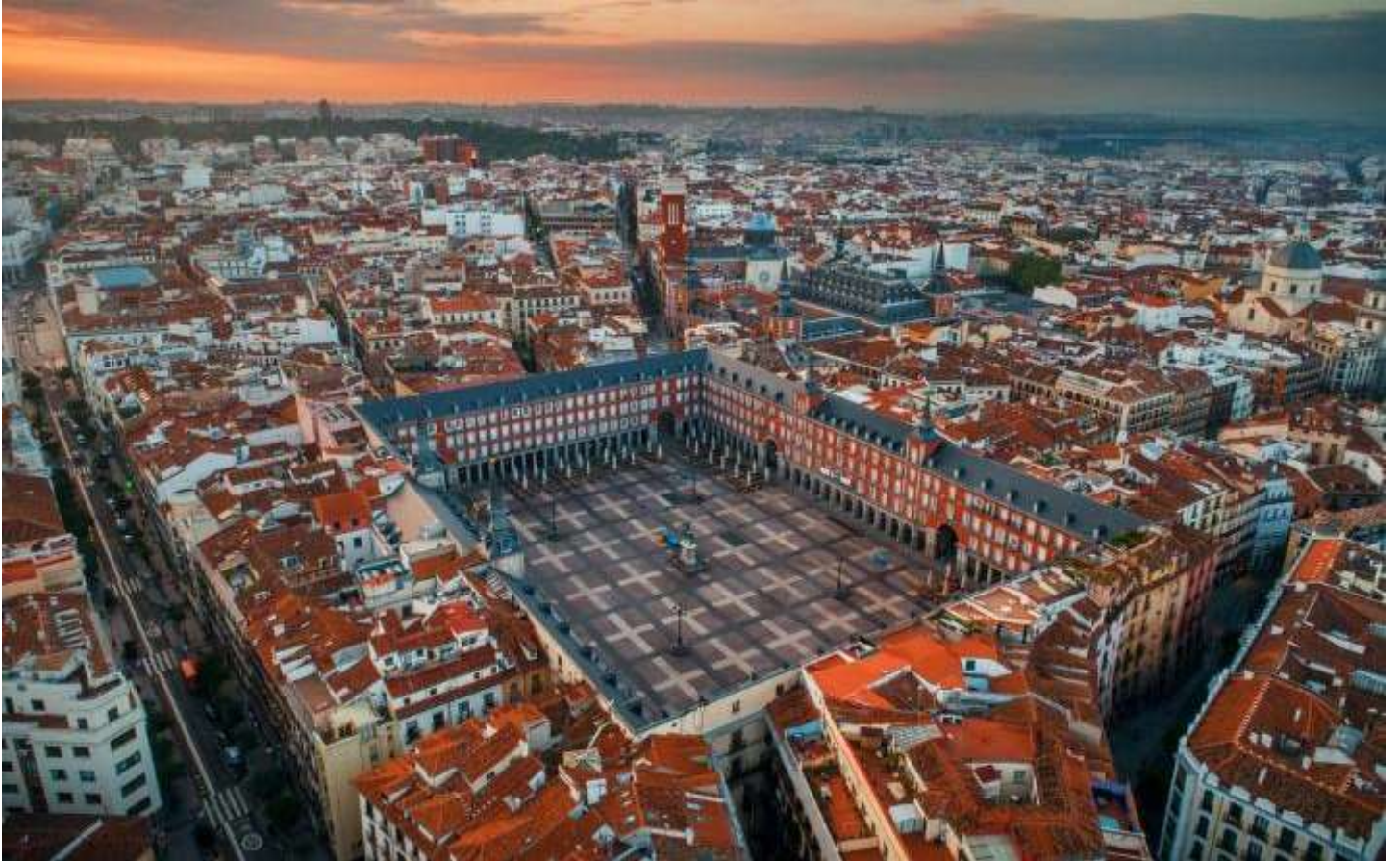
เย็น รับประทานอาหารเย็น ณ ภัตตาคาร

อิสระทุกท่านที่ จัตุรัสพลาซา มายอร์ (Plaza Mayor) จัตุรัสประวัติศาสตร์ใจกลางกรุงมาดริด สร้างขึ้นในคริสต์ศตวรรษที่ 17 เคยใช้เป็นสถานที่จัดพระราชพิธี งานเฉลิมฉลอง และกิจกรรมสำคัญของเมืองในอดีต ปัจจุบันเป็นจุดศูนย์รวมของชีวิตชาวมาดริดและนักท่องเที่ยว จัตุรัสแห่งนี้รายล้อมด้วยอาคารสถาปัตยกรรมสเปนดั้งเดิมโดดเด่นด้วยระเบียงและซุ้มโค้งอันเป็นเอกลักษณ์ บรรยากาศคลาสสิกและคึกคัก เหมาะแก่การเดินเล่น พักผ่อน อีกทั้งบริเวณโดยรอบรายล้อมด้วยร้านอาหาร คาเฟ่ และ ร้านค้าของที่ระลึก จำหน่ายสินค้าพื้นเมือง งานหัตถศิลป์ ของฝาก และสินค้าที่สะท้อนเอกลักษณ์ของสเปน อีกทั้งยังเชื่อมต่อกับถนนสายช้อปปิ้งในย่านเมืองเก่า ให้ท่านอิสระเดินเล่นเลือกซื้อสินค้า และถ่ายภาพท่ามกลางบรรยากาศคลาสสิกอันมีเสน่ห์ของกรุงมาดริด