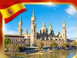
วิหารพระแม่มารีย์ ซาราโกซา