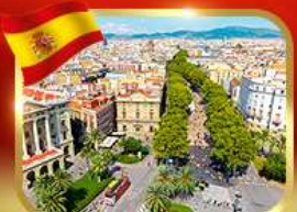
ลารัมบลาสตริก บาร์เซโลนา