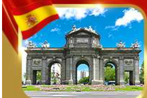
เข็ควินประตูอัลกาลา มาดริด