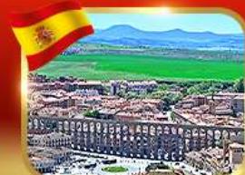
เที่ยวเมืองมรดกโลก เซโกเวีย