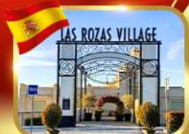
Las Rozas Village ฮาท์เทลิน