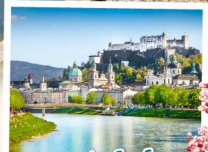
ซาลซ์บวร์ก