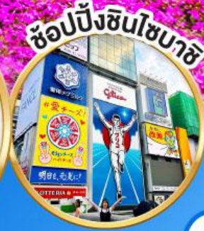
ช้อปปิ้งชินโซบาช