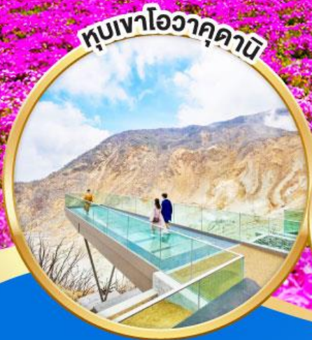
หุบเขาโอวาคุดานิ