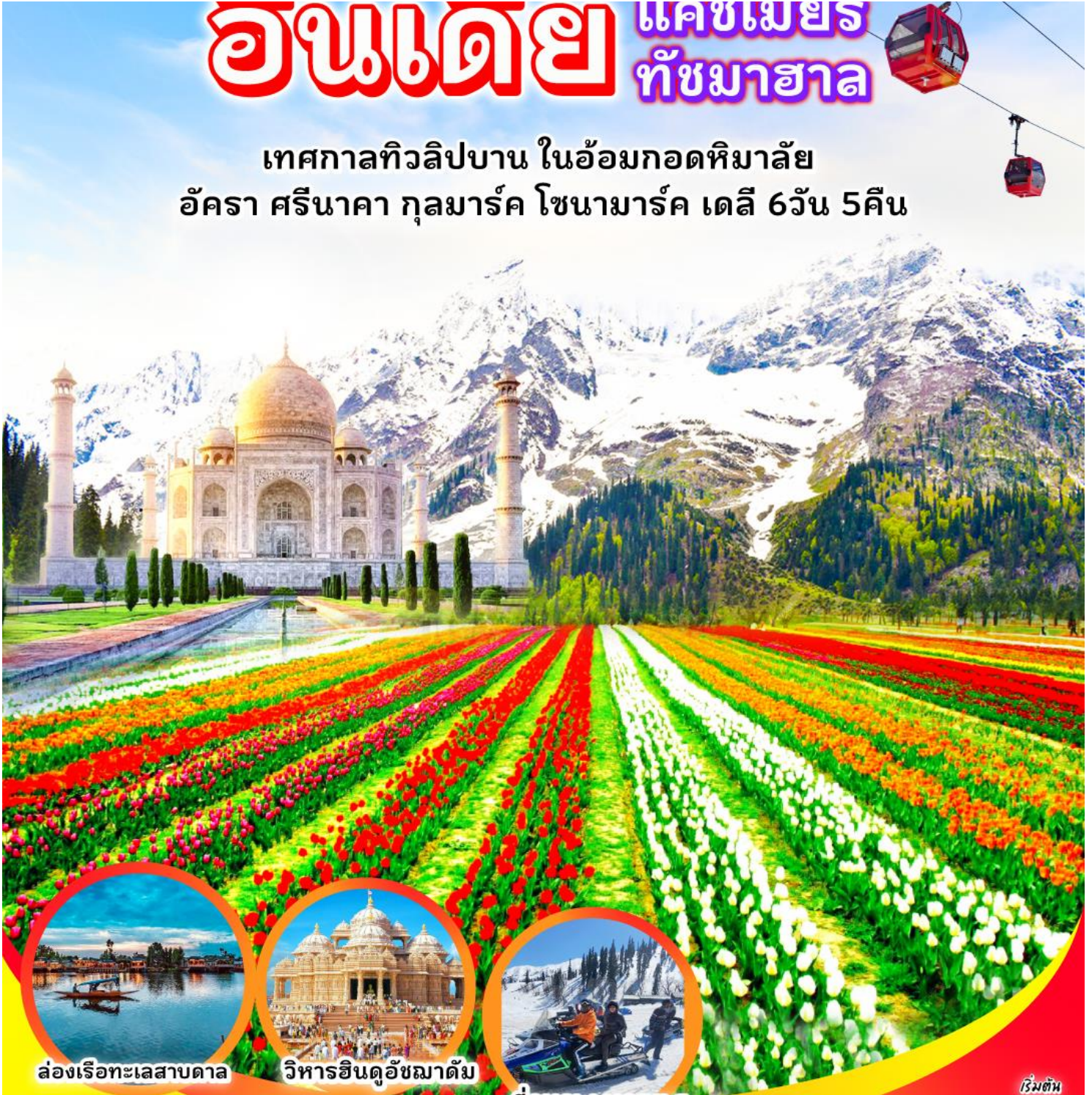
ล่องเรือทะเลสาบดาล

เทศกาลทิวลิปบาน ในอ้อมกอดหิมาล้ำ อัครา ศรีนาคา กุลมาร์ค โซนามาร์ค เดลี 6วัน 5คืน