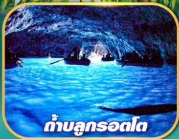
ถ้ำลูกเรือโด