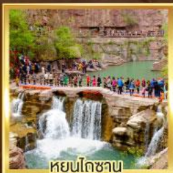
หยุ่นโกซา