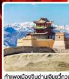
กำแพงเมืองจีนด่านเสียวี่กวน

• ไซโล่...เส้นทางสายไหม ชมสระบัววังพระจันทร์ ทะเลทรายผิงซาซาน กำแพงเมืองจีนด่านสุดท้าย "เจียวี่กวน" มรดกโลกภูเขาสายรุ้งจางเย่