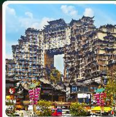
ตึกหัตถกรรม 72