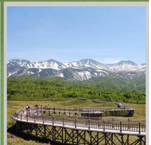
"SHIRETOKO 5 LAKES"