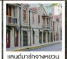
แลนด์มาร์กจางหยวน

เซี่ยงไฮ้ คาสสิก ไนท์ / 3 ดึกใหญ่แห่งเซี่ยงไฮ้ คองเรือหมู่บ้านโบราณจูเจียเจียว / EKA Tianwu / วัดหลงหัว แลนด์มาร์ก จางหยวน / ถนนหวยไห่ / ชมโชว์ ERA ที่โรงละครโด่งดังระดับโลก / ซินเทียนตี้