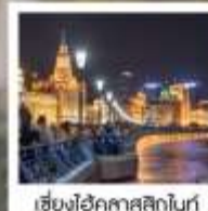
เซี่ยงไฮ้คาสสิกไนท์