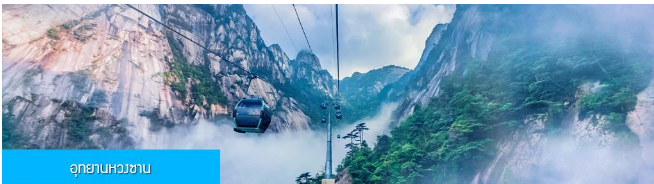
อุทยานหวงชาน