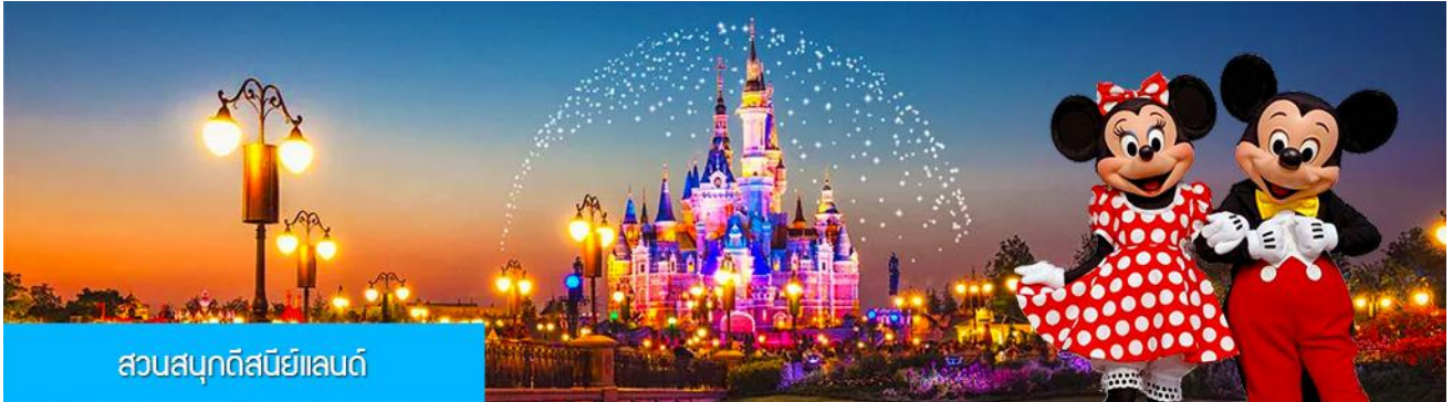
สวนสนุกดิสนีย์แลนด์

พักที่ โรงแรม Tongpai Hotel or Fangyi Hotel 4* หรือเทียบเท่าในเมืองเชียงใหม่