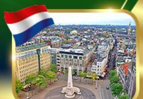
จัตุรัสดีนสแควร์ อัมสเตอร์ดัม