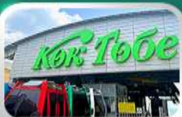
ซิมโกลโกเบชมวิวอัลมาตี

นั่งกระเช้าซิมบูลัค-ทะเลสาบโคลไซ-โบสถ์เซนต์คอป