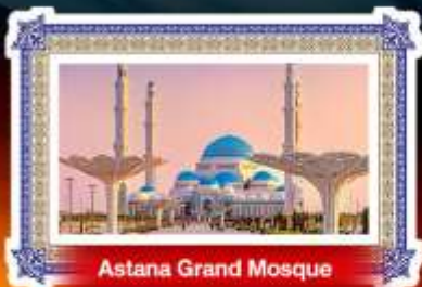
Astana Grand Mosque