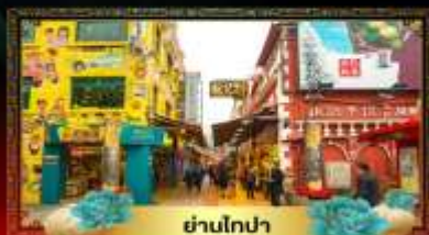
ย่านโกปา