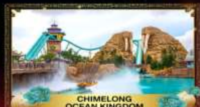
CHIMELONG OCEAN KINGDOM