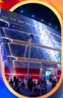
เรือเดอะหลุยส์