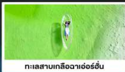
ทะเลสาบเกลือดาเอ๋อร์อัน