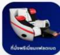
ที่นั่งพรีเิมียมเฟลตเบด