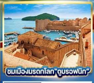
ชมเมืองมรดกโลก "ดูบรอฟนิก"