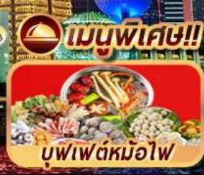
เมนูพิเศษ!! บุฟเฟ่ต์หม้อไฟ