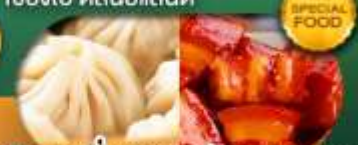
พิเศษ เสี่ยวหลงเป่า หมูแดงพอ เดินทาง ม.ค. - มิ.ย. 69