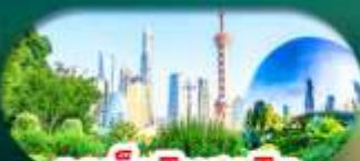
จุดเช็คอินสุดฮิต North Bund Shanghai

เซี่ยงไฮ้ หางโจว ล่องทะเลสาบซีหู ฟรีเดย์